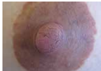
DESPUES DE 5 DIAS - FIN DEL TRATAMIENTO