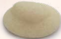
Almohadilla Nursicare saturada - debe ser reemplazada