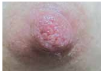
DESPUÉS DE 7 DÍAS - FIN DEL TRATAMIENTO