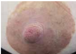
DESPUES DE 2 DIAS