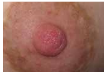
DESPUÉS DE 4 DÍAS - FIN DEL TRATAMIENTO