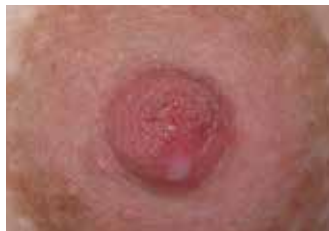
DESPUÉS DE 1 DÍA