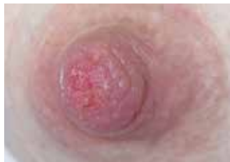
DESPUES DE 3 DIAS