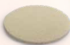
Almohadilla húmeda Nursicare - no necesita ser reemplazada

Se puede utilizar Nursicare hasta que el líquido presente sea visible a través de la parte trasera etiquetada del mismo, y antes de que llegue al borde de la almohadilla. Cambiela inmediatamente si está saturada de leche. Las almohadillas Nursicare no son lavables; el lavado puede eliminar los ingredientes y disminuir el modo de acción. Desechar después de su uso.